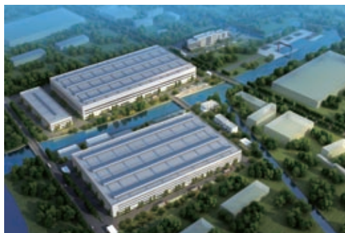
江蘇鍍錫鋼片廠鳥瞰視圖

隨著中國及亞洲其他國家生活水平的提高及生活方式的改變，本集團對高質食品及飲料包裝材料的市場需求持樂觀態度。