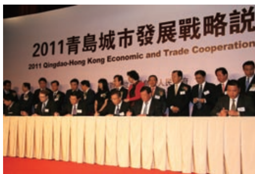
青島城市發展戰略說明會簽約儀式

本集團已初步取得300畝土地，該土地的總存儲量最少為200萬噸，年加工量超過1,000萬噸。通過此計劃，本集團旨在將其自身定位為中國的主要綜合物流及鐵礦石及煤炭加工中心。本集團正與高端的鐵礦及煤礦洽商，以期在青島董家口設立鐵礦石及煤炭加工廠事宜。