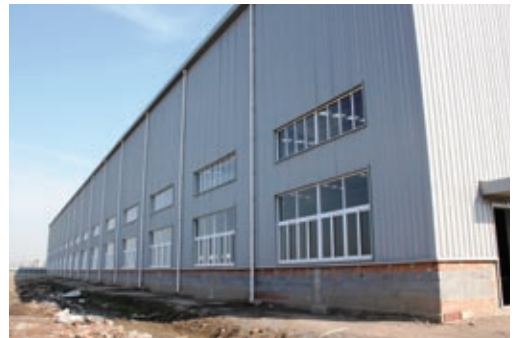
天津市的鋼材加工廠

關於泰州鋼鐵廢料加工業的未來發展計劃，自本公司截至二零一零年十月三十一日止六個月之中期報告日期起至本報告日期未有進一步變更。但是，本公司仍積極地與合作夥伴及當地政府機構商議泰州鋼鐵廢料加工業項目的條款。倘有關條款完成後，本公司會按照香港上市規則發出公佈。截至本報告日期，本集團未曾就所述項目產生任何成本。